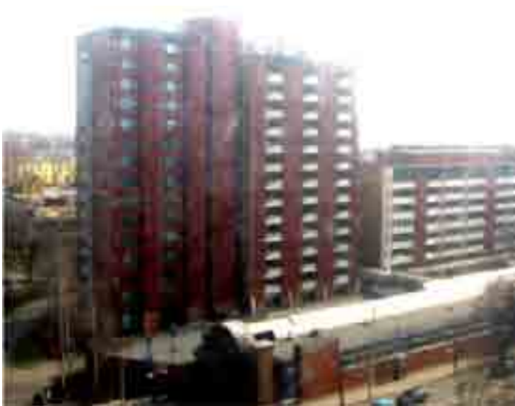
Utsikt fra tårnet i Bjølsen Valsemølle i dag.

Etterpå var det ekstraforpleining. Karbonadekaker, tre piecer på mann som det heter til sjøs, og en halv pils.